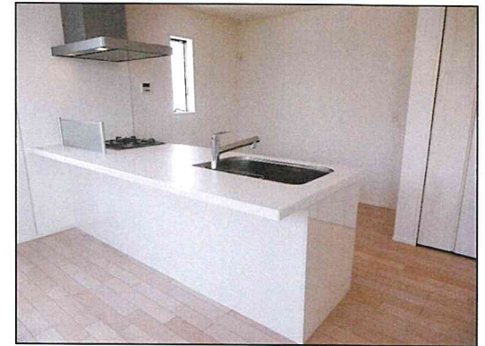
カフェスタイルキッチン(同仕様)

地盤10年保証 ダイライト工法 居室ペアガラス Low-Eガラス フラット35S 適合物件