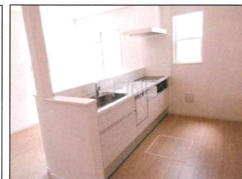
食洗機付キッチン 【現地撮影】