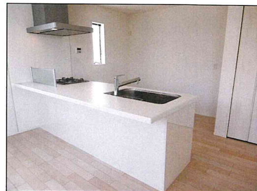
カフェスタイルキッチン(同仕様)

地盤10年保証 ダイライト工法 居室ペアガラス フラット35S Low-Eガラス フラット35S 適合物件