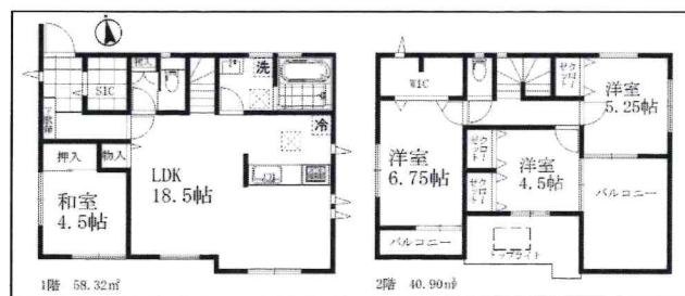
3号棟平面図 販売価格3280万円(税込)