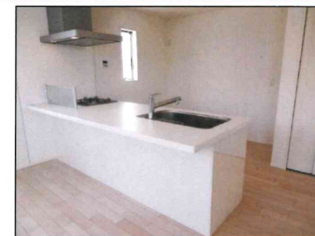
同仕様キッチンイメージ