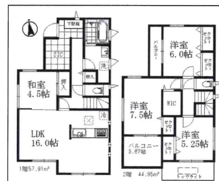
2号棟平面図 販売価格3380万円(税込)