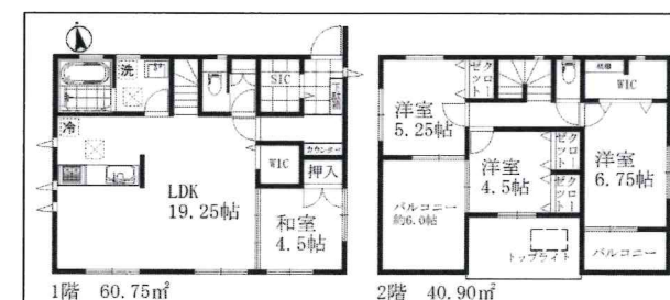
4号棟平面図 販売価格3280万円(税込)

地盤10年保証 ダイライト工法 居室ペアガラス フラット35S Low-Eガラス フラット35S 適合物件