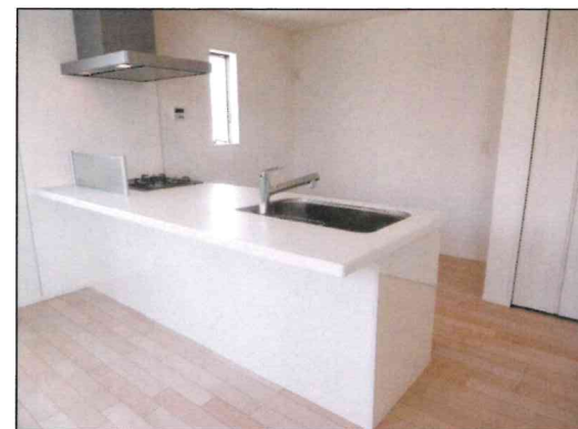
カフェスタイルキッチン(同仕様)

地盤 10年保証 ダイライト 工法 居室ペアガラス LOW-Eガラス フラット35S 適合物件